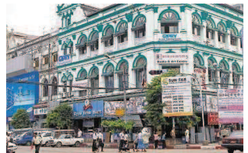
Noch gibt es im Zentrum Yangons viele koloniale Altbauten

YANGON Myanmar's Metropole und einstige Hauptstadt kämpft mit schnellem Wachstum