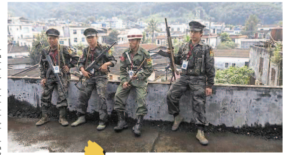
Kämpfer der Kachin Independence Army (KIA) in Laiza

zukommen. Regierungen westlicher Staaten ändern nicht nur ihre Politik gegenüber der neuen Regierung und schwächen die Sanktionspolitik, sondern fordern auch die Exilmedien auf, einen anderen Ton anzuschlagen. Geldehrer forderten die Exilmedien auf, die in die Heimat zurückzukehren. Ab 2010 kehrten Journalisten allmählich auch nach Hause zurück. Erstmals konnte Hörer und Zuschauer in Myanmar ihre Hel- den persönlich hören und sehen, die sie bisher nur aus fernem Exil- medien kannten. Aber das bedeutet kein Happy End. Mit ihr- iger Abhängigkeit von Spenden und Zuwendungen ist es für die Exilmedien eine große Herausforderung, jetzt in dem