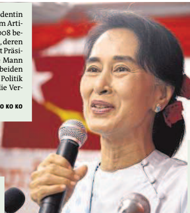
Aung San Suu Kyi im September 2013

AUNG SAN SUU KYI Große Erwartungen an die Friedensnobelpreisträgerin