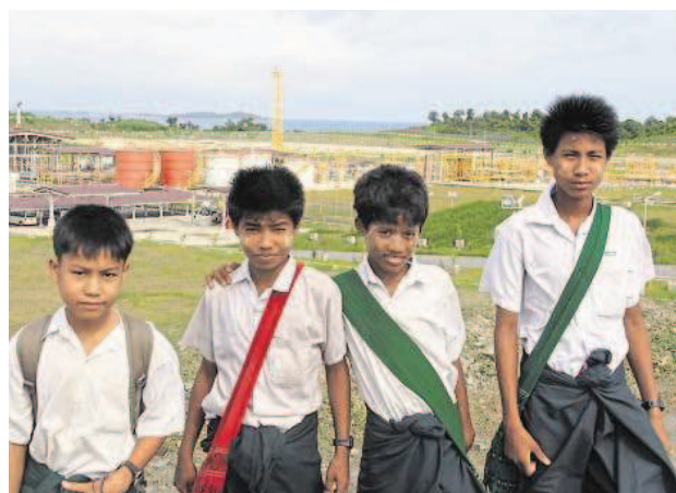
Schüler posieren vor dem Gasterminal in der Stadt Kyauk Phyu (Rakhaing-Staat)

Dies alles führte 2011 zur Entscheidung, den Bau des Myitsone-Staudamms zu stoppen, für