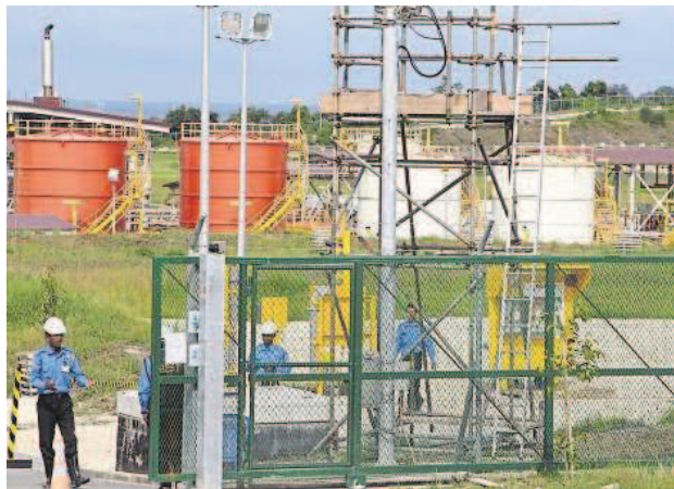
Anlage in Kyauk Phyu (Rakhaing-Staat), von der die neue Pipeline Gas von Myanmar nach China bringt

Im vorigen September besuchte ich den Rakhaing-Staat im Westen Myanmars, wo Konflikte zwischen verschiedenen Ethnien und Muslimen ausgebrochen waren. Nahe der Stadt Kyauk Phyu fördert der koreanische Daewoo-Konzern Gas, das nach China verkauft wird. Die Chinesen haben eine Pipeline