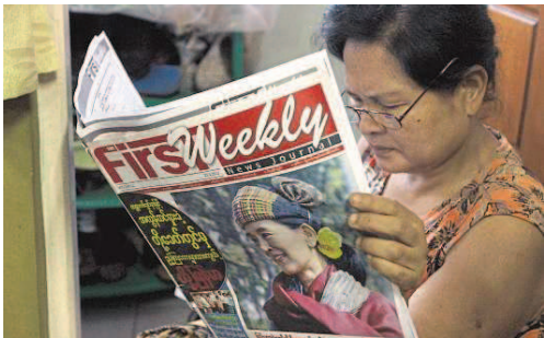
Ende der Vorkursur: Frau bei der Lektüre einer Wochenzeitung mit Aung San Suu Kyi auf dem Titel