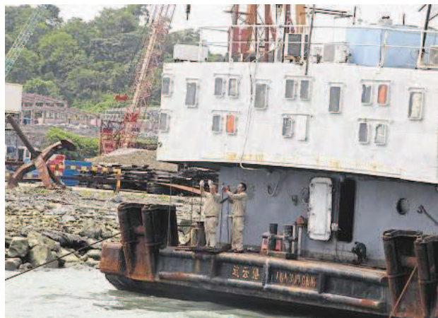
Chinesen beim Bau des Ölhafens vor Kyauk Phyu (Rakhaing), dessen Pipeline nach China führt

Aber im Rakhaing sind die Strompreise unglaublich hoch. In den Städten Rambre, Sittwe und Taungpu müssen die Menschen drei Cent pro Einheit bezahlen, wenn sie weniger als zehn Einheiten verbrauchen. Bei über zehn Einheiten steigt der Preis auf 44 Cent. Die Stromgesellschaft ist mit der Regierung eng verbunden. Also fragen sich die Anwohner: „In dieser Region gibt es reichlich Gas. Die Militärregierung hat fast alles verkauft.