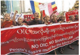
Demonstration gegen eine Delegation der Organisation der Islamischen Konferenz (OIC), die über antimuslimische Gewalt sprechen will

Die Ereignisse drohen inzwischen, die Reformbemühungen von Präsident Thein Sein zu überschatten. Der Chef der Muslim-Vereinigung Myanmar, Myint Thein, sagt: „Buddhisten und Muslime haben lange Zeit in Myanmar friedlich miteinander gelebt, ohne dass etwas passiert. Nun häufen sich die Zwischenfälle.“ Er zieht eine Verbindung zum buddhistischen 969-Bewegung, die das Land mit Hass-Reden überziehe. „Sie ist sehr populär.“ Die 969-Bewegung lehnt die Verantwortung ab. Sie ist einationalistische, antimuslimische Gruppe, angeführt vom Mönch Wirathu. Die Zahl 969 bezieht sich auf Eigenschafften Buddhas, seine Lehre und die der Mönche. Wirathu wirbt für ein Gesetz, dass Buddhisten verbietet, Parteinahme an Glaubensrichtungen. Er hat bereits vier Millionen