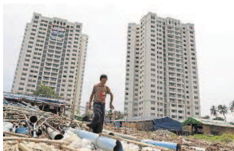
Teure Neubauten am Stadtrand – für Ausländer und Reiche